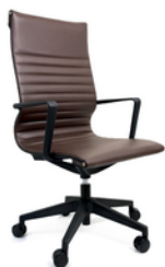
BOGOTA Alto Chocolate