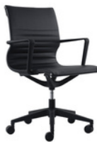
BOGOTA Bajo Negro