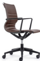
BOGOTA Bajo Chocolate