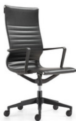
BOGOTA Alto Negro